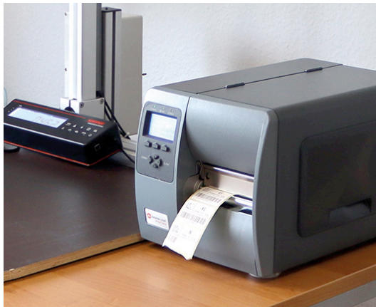
integrierter Drucker und Waage